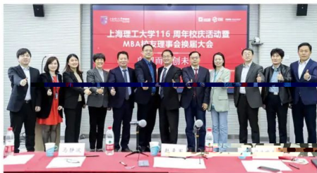
MBA校友理事会换届大会