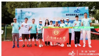
中国皮划艇友谊赛