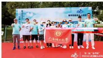
中国皮划艇友谊赛