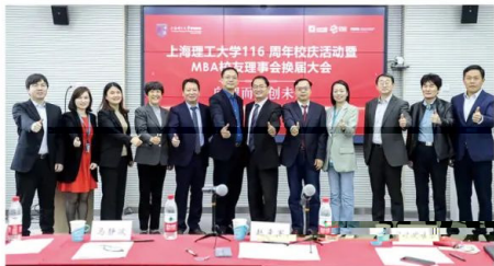
MBA校友理事会换届大会