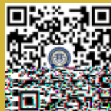
上海财经大学 MBA 订阅号

地址 >> 上海市中山北一路 369 号 邮编 >> 200083 电话 >> 021-65580018 网址 >> http://cob.sufe.edu.cn/MBA 邮箱 >> cobadmissions@mail.sufe.edu.cn 微信 >> 上海财经大学 MBA